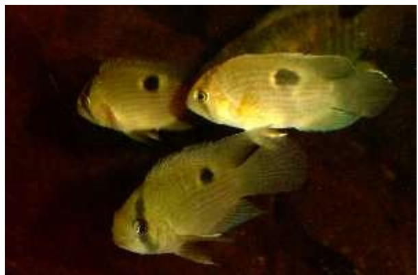
Illustration 4: Cleithracara maronii

La reproduction se fait sur substrat découvert.