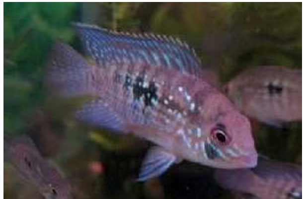
Illustration 3: Aequidens pulcher (Acara bleu)