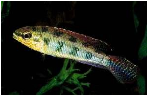
Illustration 7: Dicrossus filamentosus

La reproduction des espèces de ce genre n'est pas des plus faciles.