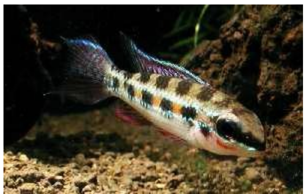
Illustration 8: Dicrossus maculatus