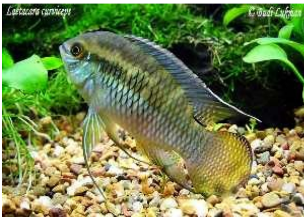
Illustration 10: L. curviceps

Leur reproduction ne pose généralement pas de problème pour peu que la maintenance soit correcte.