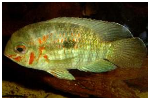
Illustration 9: " Krobia " sp Xingu

Ils ne sont pas très regardants sur les paramètres physico-chimiques de l'eau, et une bonne eau du robinet à une température de 25-26°C est préférable pour la reproduction, qui a lieu sur substrat découvert.