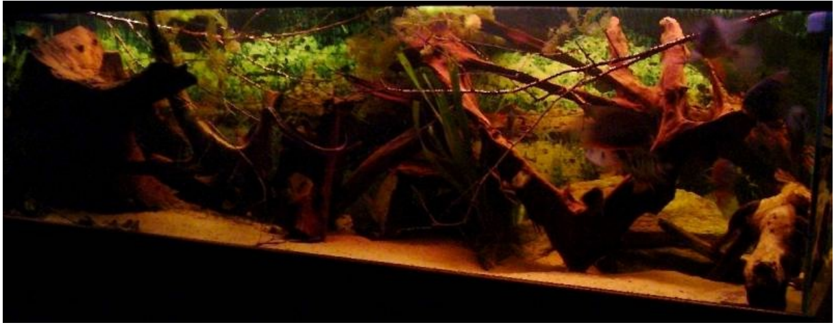
Illustration 1: Mon décor préféré...

Le décor habituellement proposé pour un bac amazonien va de modérément à très fortement planté, à tel point que pour beaucoup d'aquariophiles, bac planté = bac amazonien. Or une grande partie des paysages amazoniens immergés sont dépourvus de plantes en réalité... A vous de trouver le bon compromis en fonction de vos goûts.