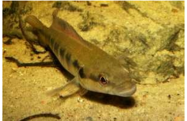
Illustration 5: Crenicichla geayi

La maintenance se fait de préférence en couple, idéalement formé au sein d'un petit groupe. Mais leur relative intolérance intraspécifique obligera à une observation quotidienne afin de pouvoir récupérer un individus malmené. On peut aussi prévoir un mâle et une femelle, laisser la femelle s'approprier le bac en maintenant le mâle dans une boîte en plexi percée de trous : ils s'acceptent parfois plus facilement ainsi.