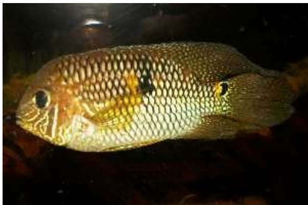
Illustration 2: Aequidens metae

Les dimensions de l'aquarium qui nous concerne sont un minimum pour Aequidens metae et les espèces proches, mais conviennent aisément à Aequidens pulcher par exemple.