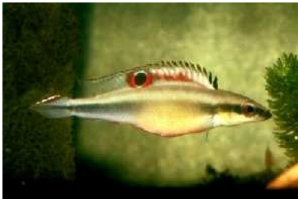
Illustration 6: Crenicichla notophthalmus