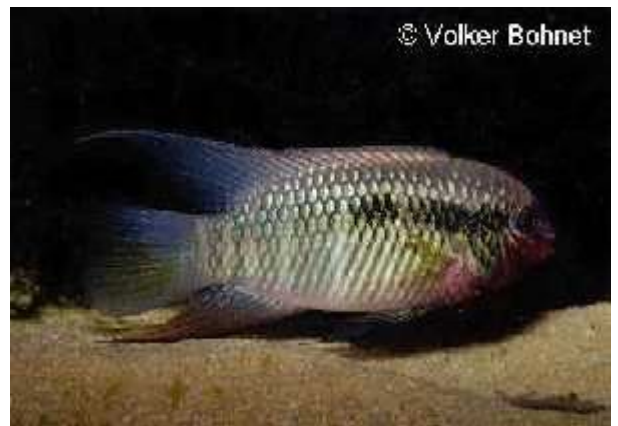
Illustration 11: L. sp "orangeflossen"