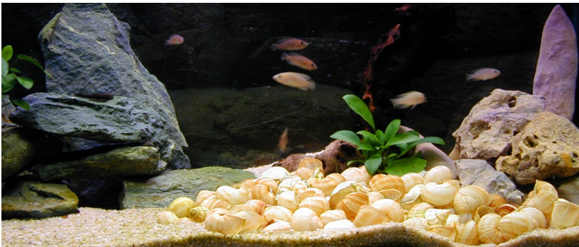
Illustration 1: Bac Tanganyika, Neolamprologus Multifasciatus