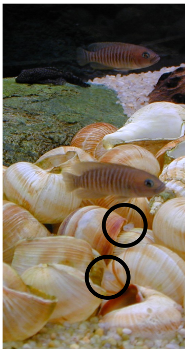
Illustration 3: Neolamprologus Multifasciatus, alevins